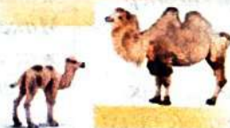
Түйенің жүнінінен жылы жейде, шұлық, қолғап тоқып,